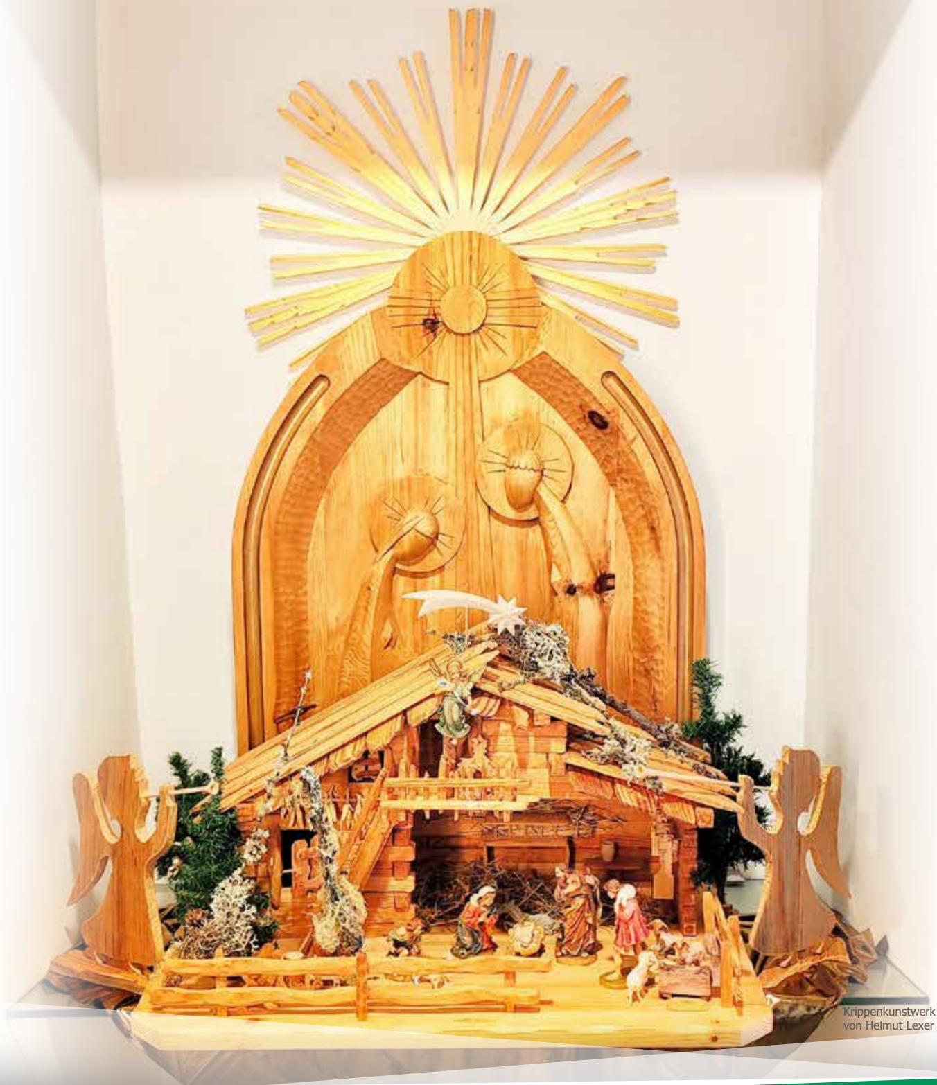
Krippenkunstwerk von Helmut Lexner